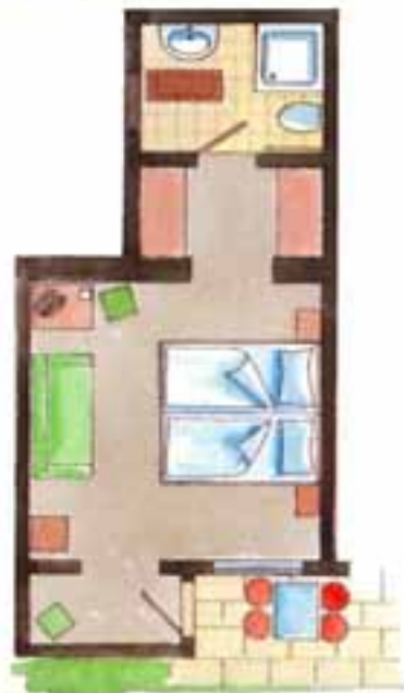
Zimmer Nr. 3 (ca. 24 qm) Süd / Terrasse