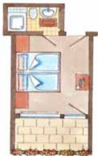
Zimmer Nr. 7 + 14 (ca. 15 qm) Süd / Balkon