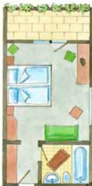
Zimmer Nr. 27 (ca. 27 qm) Süd / Balkon