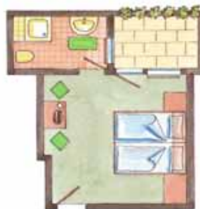
Zimmer Nr. 9 + 16 (ca. 20 qm) Süd / Balkon