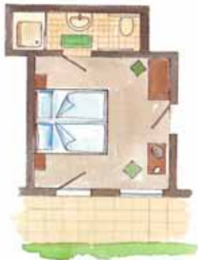
Zimmer Nr. 2 (ca. 18,5 qm) Süd / Terrasse