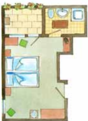
Zimmer Nr. 11 (ca. 22,3 qm) Ost / Terrasse Zimmer Nr. 18 (ca. 22,3 qm) Ost / Balkon