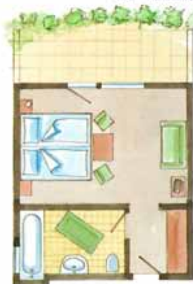
Zimmer Nr. 24, 31, 35 (ca. 26,5 qm) Ost / Terrasse oder Balkon