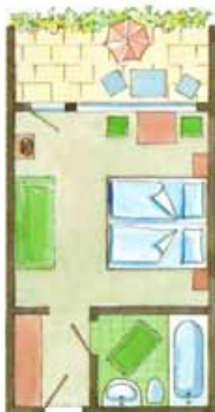
Zimmer Nr. 20, 21, 22, 29, 33 (ca. 24 qm) Süd / Terrasse