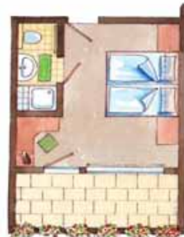
Zimmer Nr. 8 + 15 (ca. 18,5 qm) Süd / Balkon