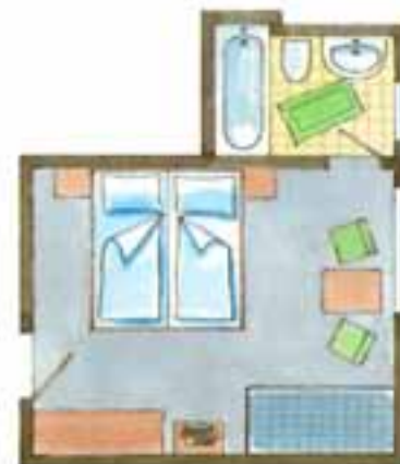
Zimmer Nr. 25 + 32 (ca. 22,5 qm) Nord / ohne Terrasse, oder Balkon