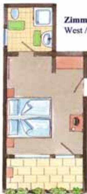
Zimmer Nr. 6 + 12 (ca. 22 qm) West / Balkon