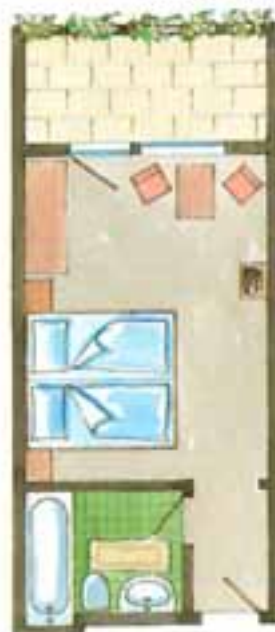
Zimmer Nr. 28 (ca. 18 qm) Süd / Balkon