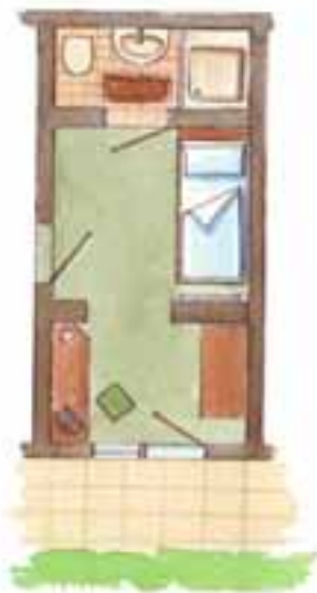
Zimmer Nr. 1 (ca. 13 qm) Süd / Terrasse