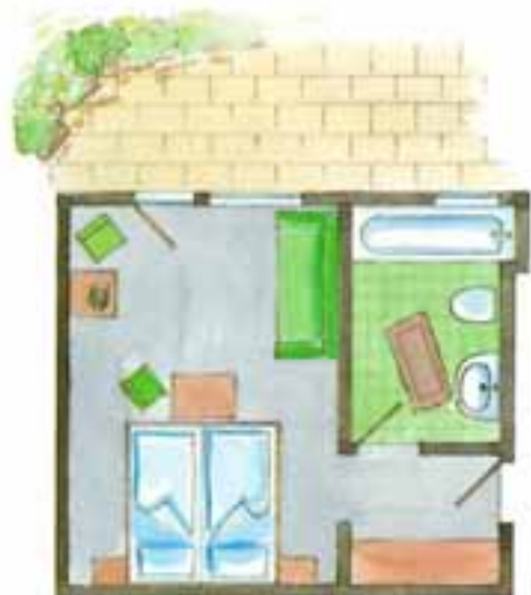
Zimmer Nr. 23, 24 (ca. 26 qm) Süd / Terrasse Zimmer Nr. 30 (ca. 26 qm) Süd / Balkon